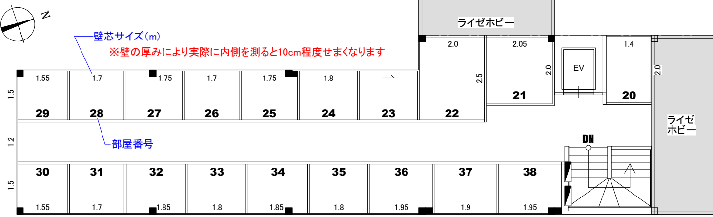
2階 平面図 (19ルーム)